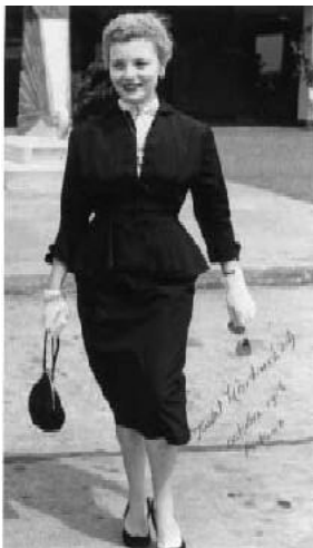
María Estela Martínez de Perón, en octubre de 1956, en Panamá.