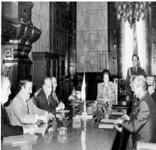
La Presidente y miembros de su gabinete escuchan al nuevo ministro de Economía, Celestino Rodrigo. La foto fue tomada el 12 de junio de 1975.

Tres días más tarde, el jueves 5 de junio de 1975, dio a conocer su plan, lo que se bautizó como “el Rodrigazo”: 12 aumentó la paridad del dólar un 100%; la nafta 175%; electricidad 75% y otras tarifas en igual o mayor medida. Las góndolas de los supermercados quedaron vacías debido al acaparamiento de los productos. “Si no hiciéramos esto —dijo Rodrigo—, la mejor industria del país sería la importación de máquinas para fabricar papel moneda. Mañana me matan o mañana empezamos a hacer las cosas bien”. En otro momento, como señalando a