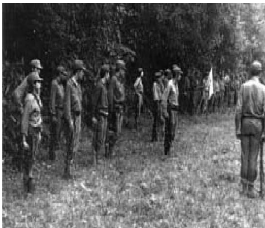
Compañía Ramón Rosa Jiménez. Provincia de Tucumán.

Para los que vivieron con intensidad esos años de “la langosta”, 1973 fue el año de los cuatro presidentes (Lanusse, Cámpora, Lastiri y Perón) y las elecciones presidenciales. El 11 de marzo triunfó la fórmula integrada por Héctor J. Cámpora y Vicente Solano Lima del Frente Justicialista de Liberación Nacional. El 25 de mayo, Alejandro Lanusse entregó la banda presidencial en la Casa Rosada. Afuera, en la Plaza de Mayo, la guerrilla sedicentemente “peronista” organizó todo tipo de desmanes. Menos de un mes más tarde, el 20 de junio, en ocasión del retomo definitivo de Perón a la Argentina, se producen los gravísimos hechos de Ezeiza.