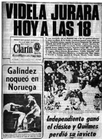
Tapas de Clarín en los días posteriores al 24 de marzo de 1976.