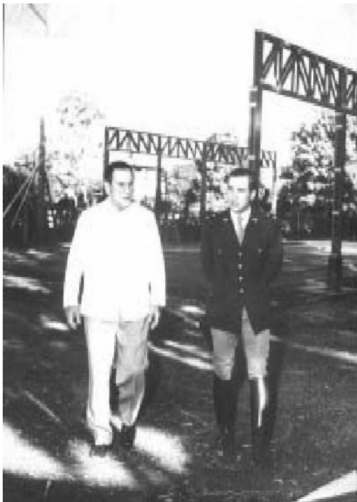
El presidente Juan Domingo Perón camina por los jardines de la residencia de Olivos en compañía