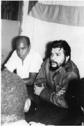
Ernesto Che Guevara con Eduardo Mondlane, fundador del FRELIMO (Frente de Liberación de Mozambique), en Dar es Salaam, Tanzania, el 14 de febrero de 1965. Al año siguiente intentaría tomar el poder en Bolivia y luego pasar a la Argentina.