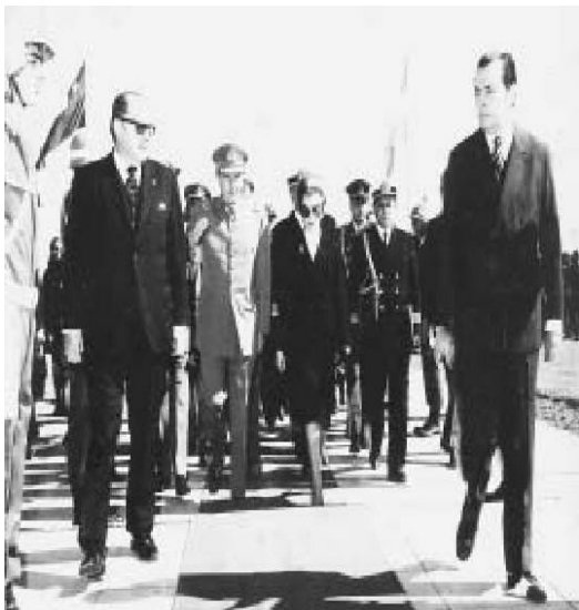
Isabel Perón y el presidente Augusto Pinochet se encuentran en la Base Aérea de Morón. Durante la cita se habló de coordinar la acción antisubversiva.