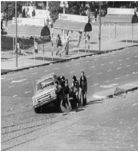
Un grupo de militantes da vuelta un auto estacionado sobre la avenida Paseo Colón, detrás de la Casa Rosada.