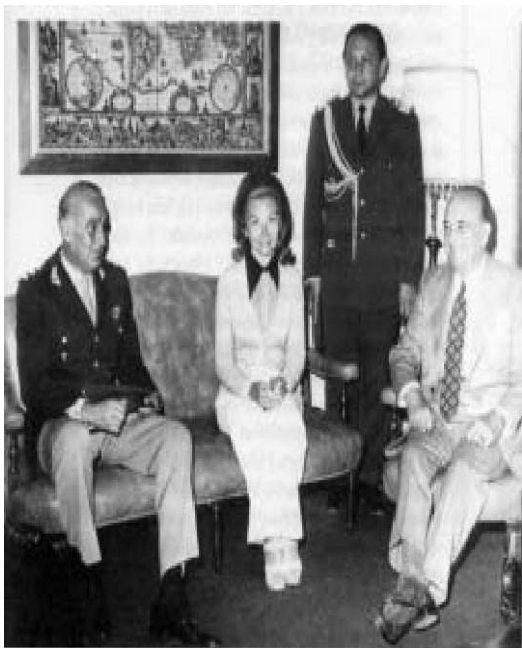
La Presidente Isabel Perón, entre el teniente general Leandro Enrique Anaya y el canciller Juan Alberto Vignes, durante su estadía en Chapadmalal.

"En uno de esos viajes de helicópteros concurre a Chapadmalal el ministro de Economía,