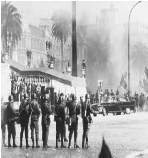
Mediodía del 25 de mayo de 1973. La Guardia de Infantería de la Policía Federal apostada en un costado de la Casa Rosada para salvaguardar a las autoridades nacionales y extranjeras de los incidentes que se producían en Plaza de Mayo.