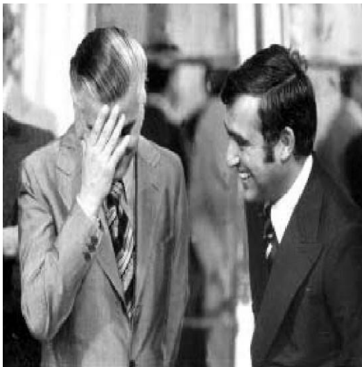
Enero de 1976. Antonio Cafiero y Carlos Federico Ruckauf se ríen en el Salón Blanco de la Casa Rosada, antes de comenzar la ceremonia de asunción de sus reemplazantes.

El miércoles 4 de febrero asume como ministro de Economía Emilio Mondelli. También jura Miguel Unamuno en lugar de Carlos Ruckauf en Trabajo. Como un emblema de los días que corren, en la ceremonia Ruckauf aparece riéndose mientras el país se deslizaba hacia el abismo. En poco más de un año y medio, Isabel Perón tuvo seis ministros del Interior, cuatro de Relaciones Exteriores, cinco de Defensa, seis de Economía, tres de Educación y Cultura, tres