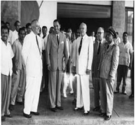
Juan Domingo Perón en Panamá (1956).