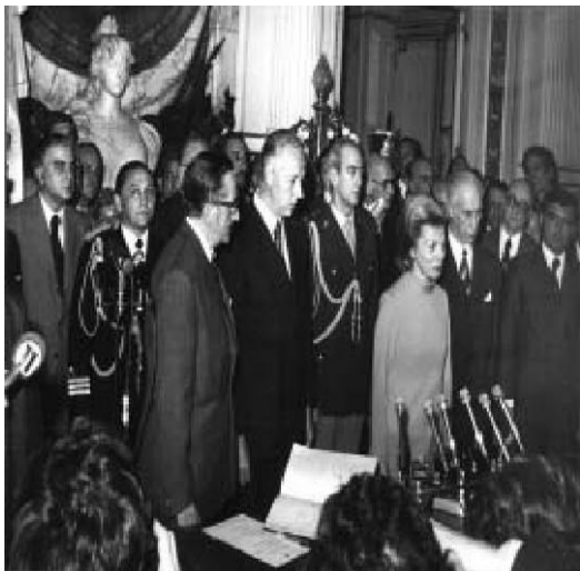
Septiembre de 1975. Isabel Perón pronuncia unas palabras en el Salón Blanco antes de partir en uso de licencia a las sierras de Córdoba. La rodean, entre otros, Antonio Cafiero, Ítalo Argentino Luder, Nicasio Sánchez Toranzo, Ángel Robledo y Carlos Ruckauf