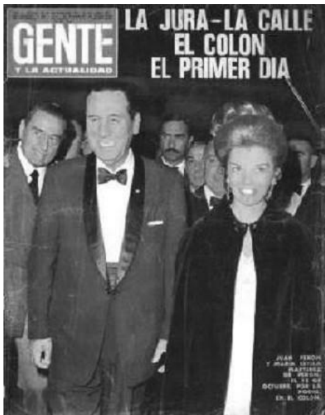
Portada de Gente, octubre de 1973, cubriendo los actos de la asunción presidencial de Juan Domingo Perón y su esposa María Estela Martínez.