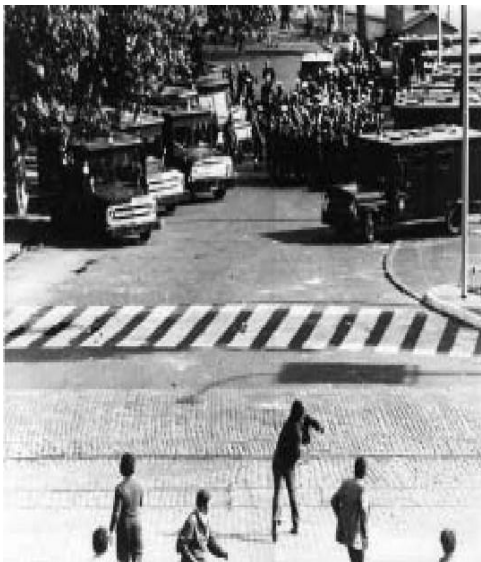
Manifestantes apedrean a efectivos de la Armada en las cercanías de la Casa de Gobierno. Estos y muchos otros incidentes impidieron el desfile militar en homenaje a las nuevas autoridades.

Una vez terminada la ceremonia volvimos a nuestra casa de Belgrano y Tacuarí y mi padre nos dijo a mi hermano mayor y a mí “vístanse con jeans y zapatillas y vamos a caminar. Estas cosas en esta vida las tienen que ver por sí solos, con sus propios ojos y