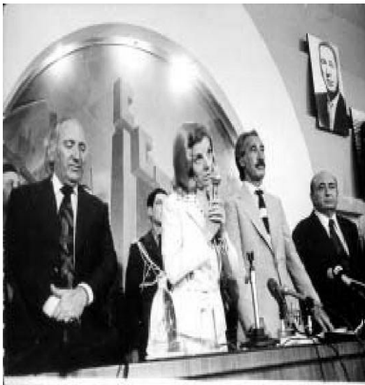
10 de marzo de 1976. “Muchachos, no me lo silben al pobre Mondelli”, pidió la Presidente a los sindicalistas durante un acto de la CGT. Isabel Perón flanqueada por Lorenzo Miguel y Casildo Herreras. Otra foto emblemática de la época.

El jueves 11 de marzo, Bittel se reunió con Ricardo Balbín. El dirigente radical se comprometió a realizar una asamblea multipartidaria, siempre y cuando el llamado a elecciones nacionales del 12 de octubre se realizara con las mismas normas legales de 1973